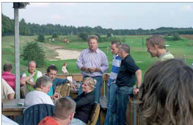
EEN VOORBEELD VAN EEN SPONSORACTIVITEIT BIJ COUNTRY GOLF EES.

Verder organiseren we periodiek bijeenkomsten voor onze sponsoren en betrekken we hem ook bij onze verenigingsactiviteiten. Op vrijwillige basis natuurlijk want niet iedere sponsor zal hier behoefte aan hebben. Voor die sponsoren die er wel prijs op stellen willen we op die manier een platform creëren waar sponsoren elkaar ook onderling kunnen ontmoeten. Om zaken te doen, maar ook om het netwerk uit te breiden of te verstevigen.